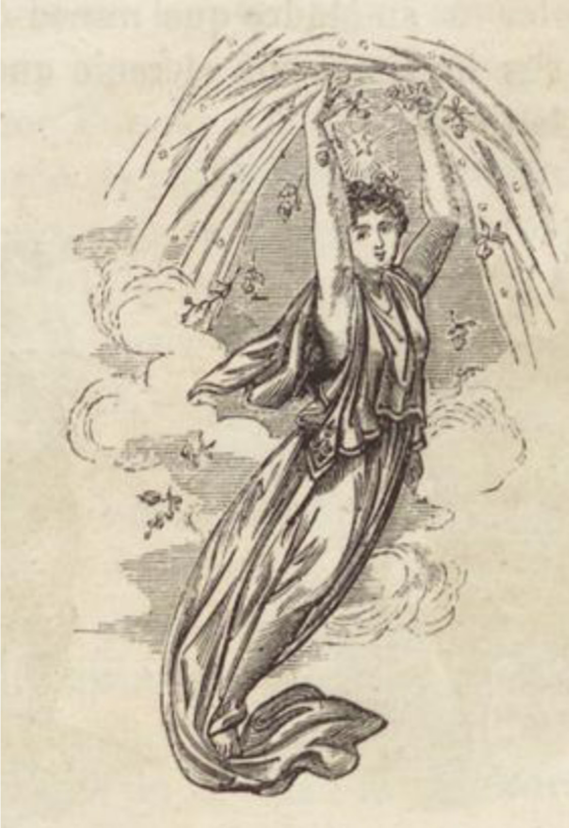
Pomona, diosa de las frutas, era una ninfa extraordinaria por su belleza y por su arte en cultivar las frutas. fué amada de todos los